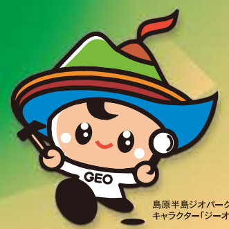
島原半島ジオパークキャラクター「ジオくん」